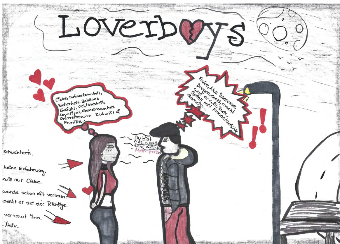
Zeichnung entstand im Rahmen des Kunstwettbewerbs zum Thema Loverboy-Methode 2025

Beratung bei Hass im Netz: www.hateaid.org