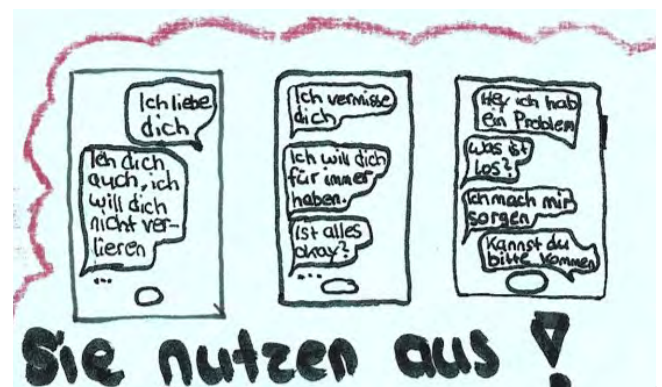
oben: Illustration einer Jugendlichen, entstanden im Rahmen des Kunstwettbewerbs zum Thema Loverboy-Methode 2025

Prävention im digitalen Raum ist dabei besonders wichtig: Jugendliche müssen für die Risiken der Online-Kommunikation sensibilisiert werden. Medienkompetenz, Aufklärung über Cybergrooming und das frühzeitige Erkennen manipulativer Taktiken sind wesentliche Bausteine.